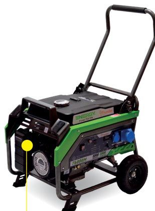
T6000M / T6000ME-A